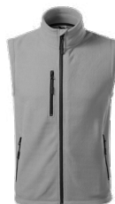
EXIT 525 kamizelka polarowa

00 23 13 07 15 14 05 87 02 60 93 59 44 19 A7 95