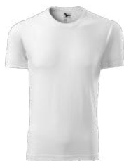
ELEMENT 145 koszulka