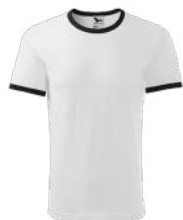
INFINITY 131 koszulka