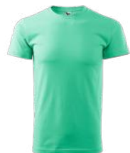
HEAVY NEW 137 koszulka