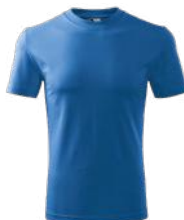
HEAVY 110 koszulka