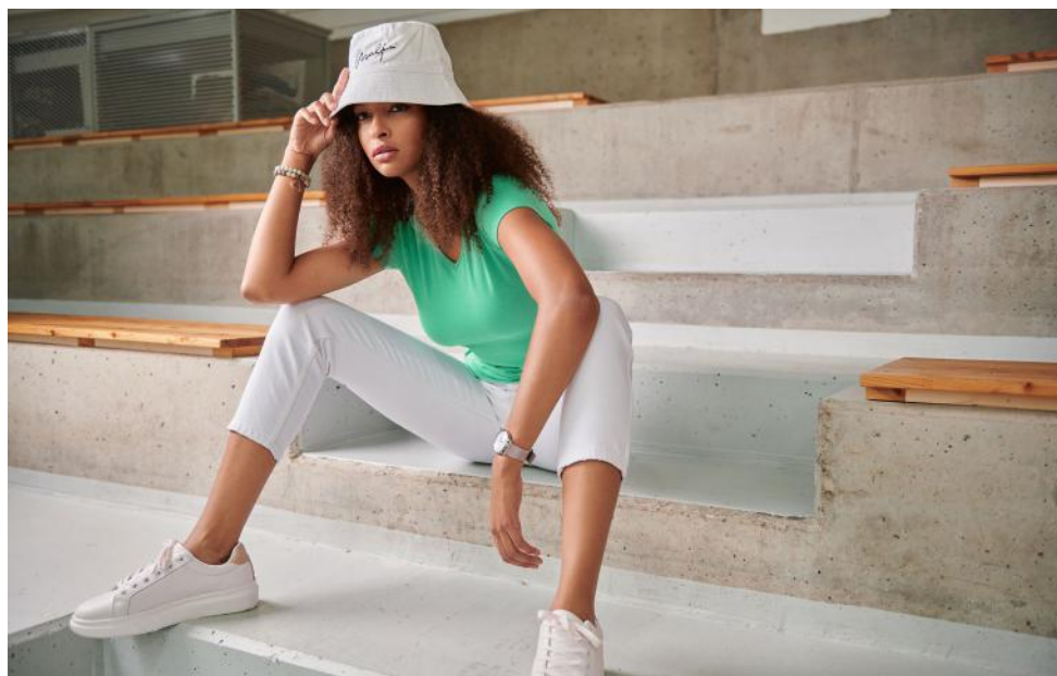
Koszulka Dream 128