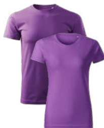
BASIC FREE F29, F34 koszulka