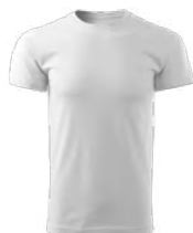
HEAVY NEW FREE F37 koszulka