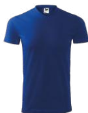
HEAVY V-NECK 111 koszulka